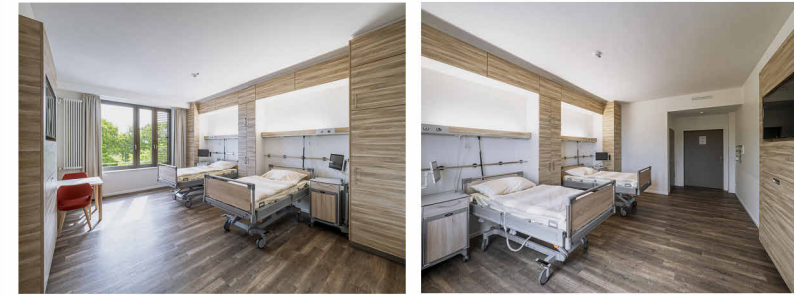
Gebautes Beispiel Krankenhaus Winsen: Bettenzimmer in der Wahlleistungsstation