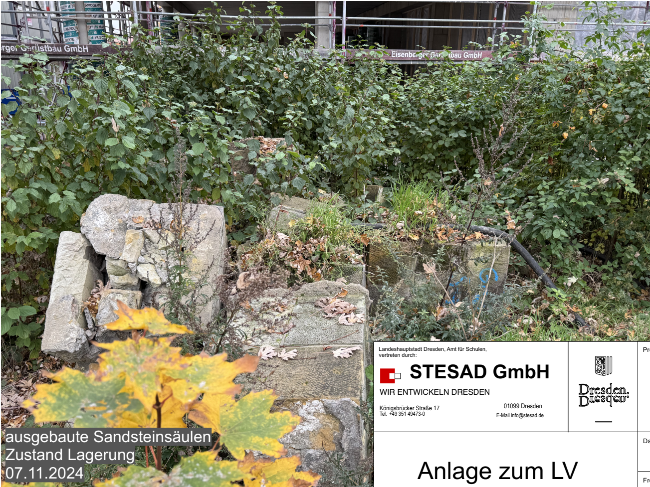
ausgebaute Sandsteinsäulen Zustand Lagerung 07.11.2024