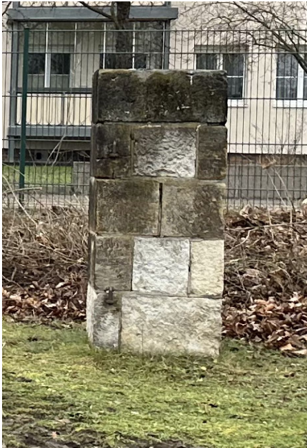
Ansicht SW, S3, Bestand 18.01.2023