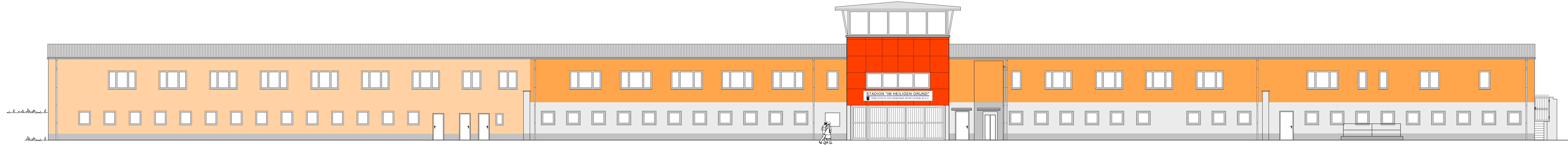
Ansicht von der Hauptzufahrtsstraße