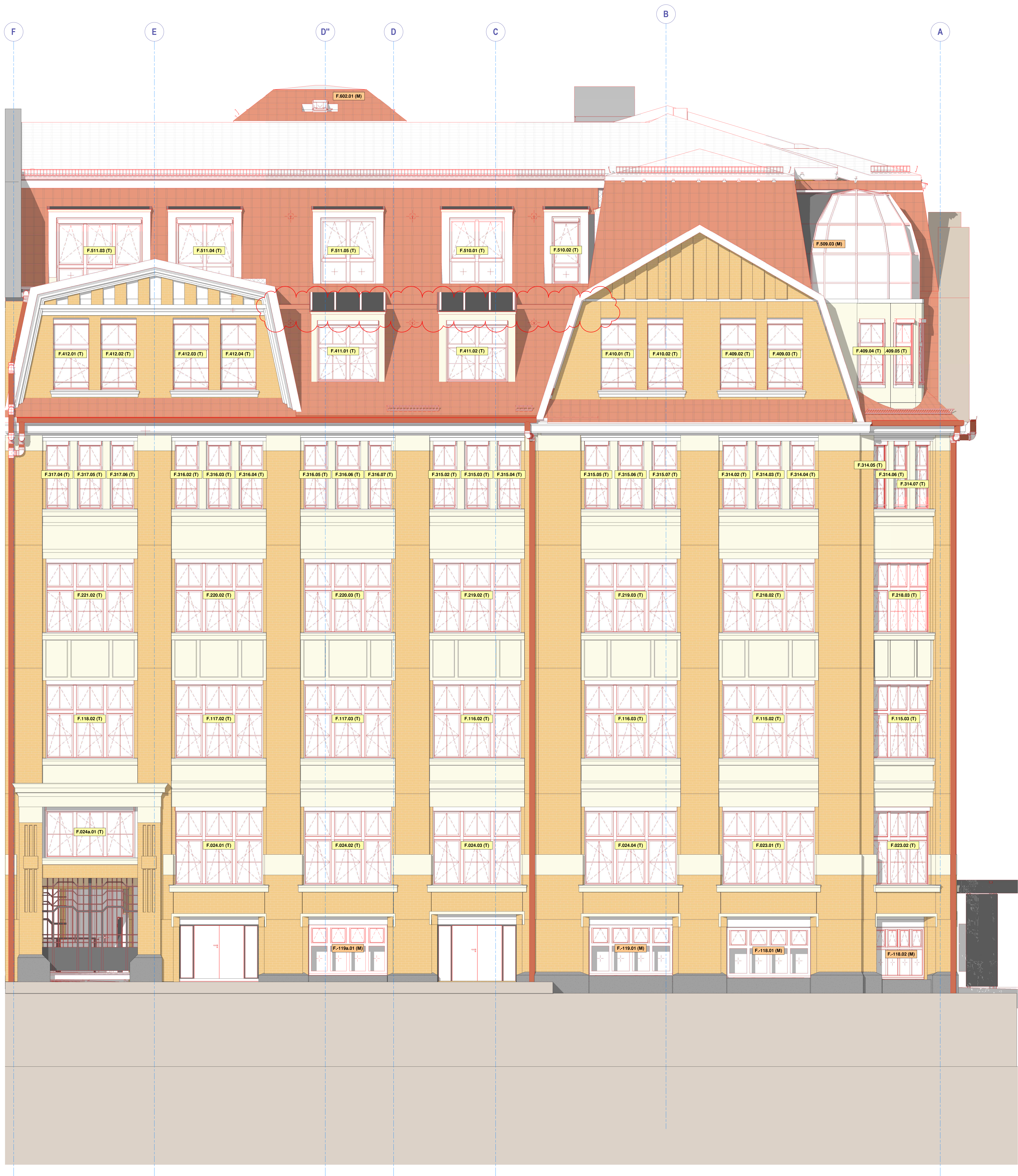
Ansicht Süd M 1 : 50