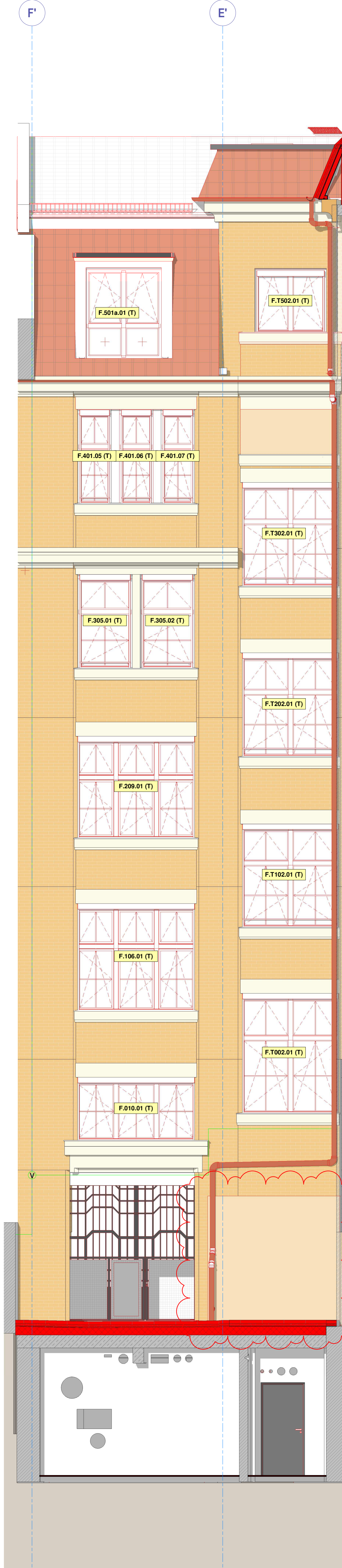
Ansicht Süd vom Nordflügel (links) M 1 : 50