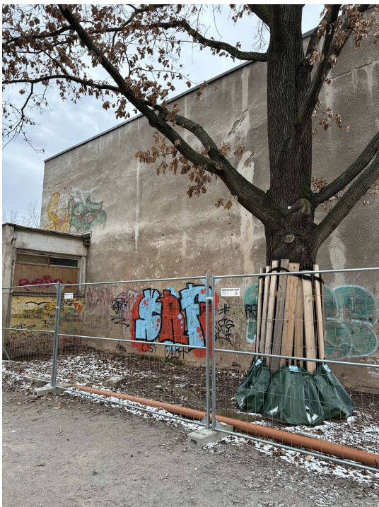
2025-01-14 Objekt- Schulstandort 49. GSSH, Bernhardstraße 80. 019Foto. Ansicht Nord-Ost: Bestandsputz mit Sokelbereich komplett entfernen (Minderfestigkeiten), Sokelbereich, Fremdbauteile entfernen und Ausgleichsputz als Klebefläche auftragen. WDVS auf tragfähigen Untergrund kleben