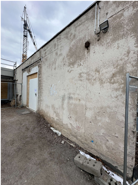
2025-01-14 Objekt- Schulstandort 49. GSSH, Bernhardstraße 80. 001Foto. Ansicht Süd-West: Bestandsputz reinigen, Sockelbereich erneuern, Fremdbauteile entfernen und ggf. grundieren. WDVS auf tragfähigen Untergrund kleben