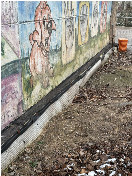
2025-01-14 Objekt- Schulstandort 49. GSSH, Bernhardstraße 80. 011Foto. Ansicht Süd-Ost: Bestandsputz mechanisch reinigen, Sokelbereich Anschluss an Perimeter herstellen, Fremdbauteile entfernen und ggf. grundieren. WDVS auf tragfähigen Untergrund kleben