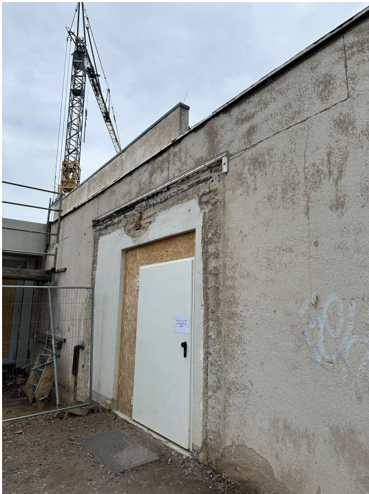
2025-01-14 Objekt- Schulstandort 49. GSSH, Bernhardstraße 80. 005Foto. Ansicht Süd-West: Bestandsputz reinigen, Sockelbereich erneuern, Fremdbauteile entferne und ggf. grundieren. WDVS auf tragfähigen Untergrund kleben