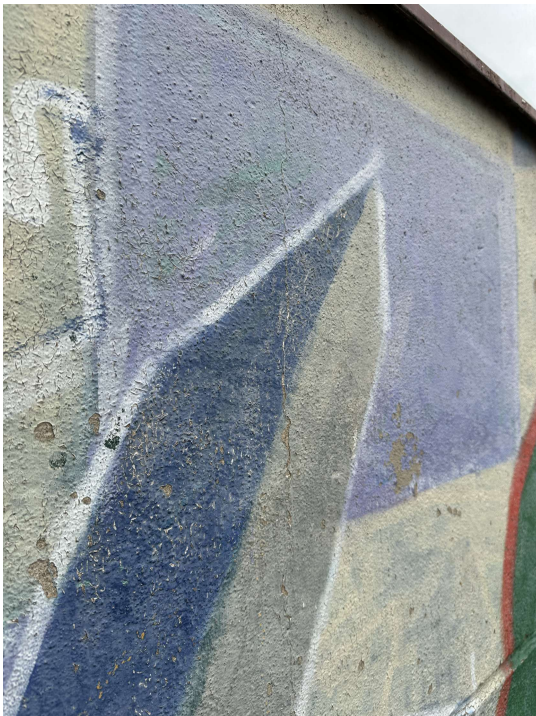
2025-01-14 Objekt- Schulstandort 49. GSSH, Bernhardstraße 80. 007Foto. Ansicht Süd-Ost: Bestandsputz mechanisch reinigen, Sockelbereich Anschluss an Perimeter herstellen, Fremdbauteile entfernen und ggf. grundieren. WDVS auf tragfähigen Untergrund kleben