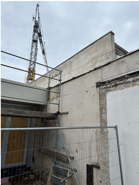
2025-01-14 Objekt- Schulstandort 49. GSSH, Bernhardstraße 80. 003Foto. Ansicht Süd-West: Bestandsputz reinigen, Sockelbereich erneuern, Fremdbauteile entfernen und ggf. grundieren. WDVS auf tragfähigen Untergrund kleben