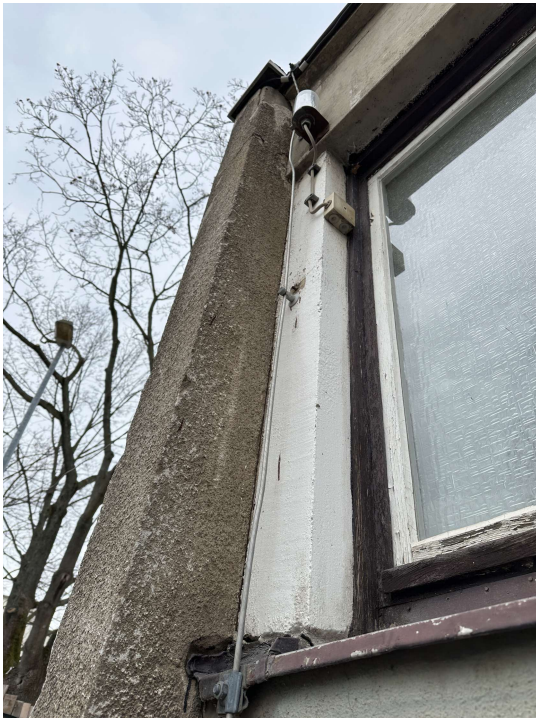
2025-01-14 Objekt- Schulstandort 49. GSSH, Bernhardstraße 80. 009Foto. Ansicht Süd-Ost: Bestandsputz mechanisch reinigen, Sokelbereich Anschluss an Perimeter herstellen, Fremdbauteile entfernen und ggf. grundieren. WDVS auf tragfähigen Untergrund kleben