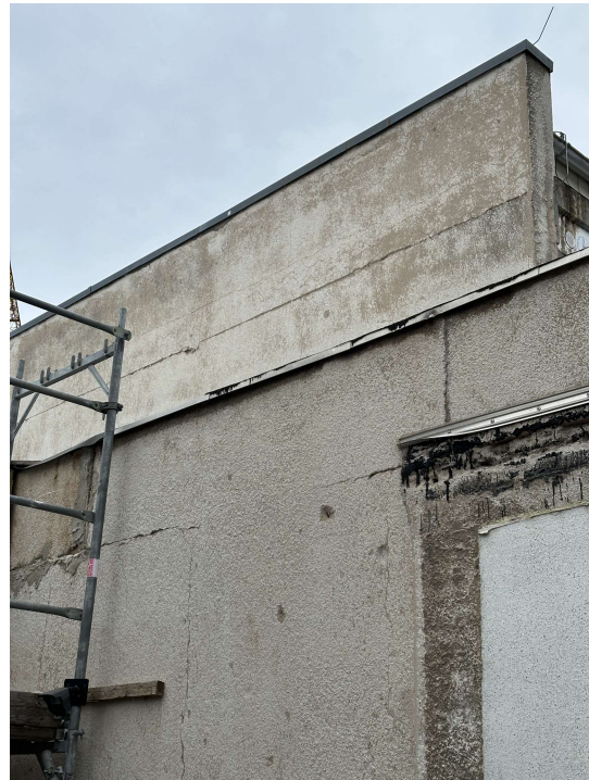
2025-01-14 Objekt- Schulstandort 49. GSSH, Bernhardstraße 80. 002Foto. Ansicht Süd-West: Bestandsputz reinigen, Sockelbereich erneuern, Fremdbauteile entfernen und ggf. grundieren. WDVS auf tragfähigen Untergrund kleben