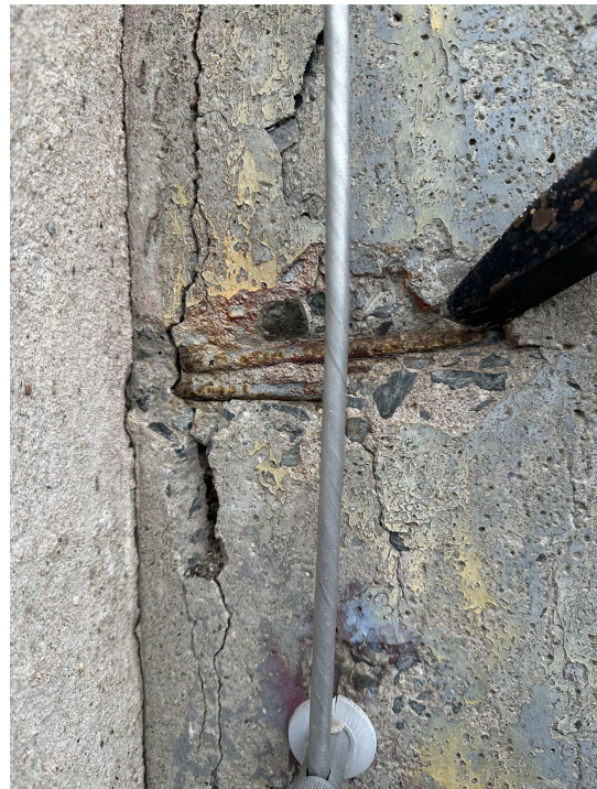
2025-01-14 Objekt- Schulstandort 49. GSSH, Bernhardstraße 80. 016Foto. Ansicht Nord-Ost: Bestandsputz mit Sokelbereich komplett entfernen (Minderfestigkeiten), Sokelbereich, Fremdbauteile entfernen und Ausgleichsputz als Klebefläche auftragen. WDVS auf tragfähigen Untergrund kleben