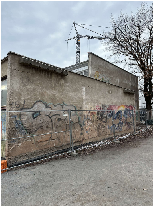
2025-01-14 Objekt- Schulstandort 49. GSSH, Bernhardstraße 80. 013Foto. Ansicht Nord-Ost: Bestandsputz mit Sokelbereich komplett entfernen (Minderfestigkeiten), Sokelbereich, Fremdbauteile entfernen und Ausgleichsputz als Klebefläche auftragen. WDVS auf tragfähigen Untergrund kleben