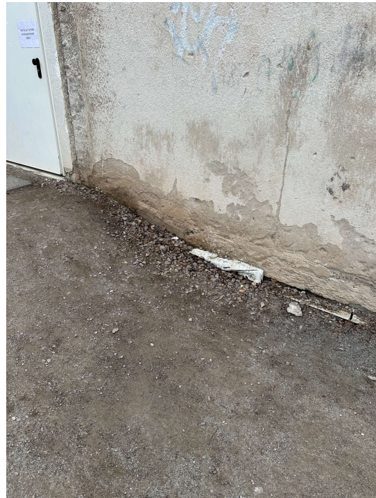
2025-01-14 Objekt- Schulstandort 49. GSSH, Bernhardstraße 80. 006Foto. Ansicht Süd-West: Bestandsputz reinigen, Sockelbereich erneuern, Fremdbauteile entferne und ggf. grundieren. WDVS auf tragfähigen Untergrund kleben