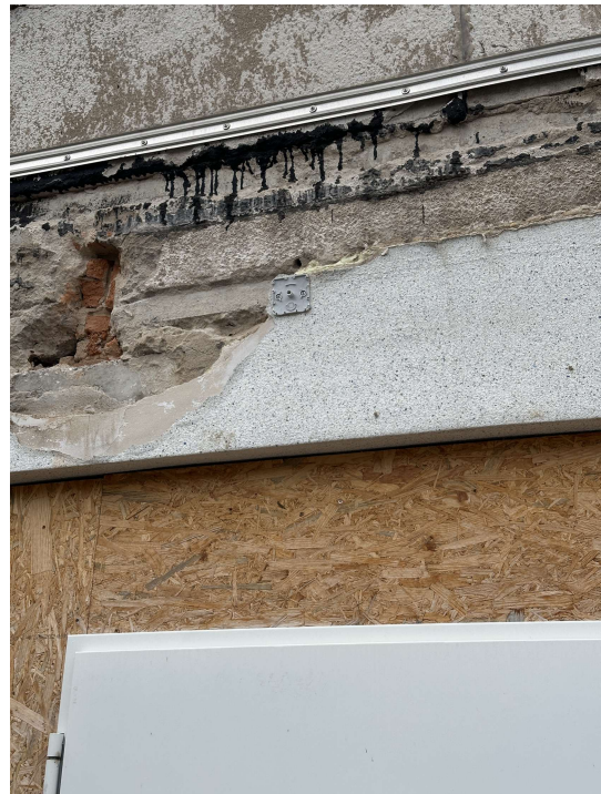
2025-01-14 Objekt- Schulstandort 49. GSSH, Bernhardstraße 80. 004Foto. Ansicht Süd-West: Bestandsputz reinigen, Sockelbereich erneuern, Fremdbauteile entfernen und ggf. grundieren. WDVS auf tragfähigen Untergrund kleben