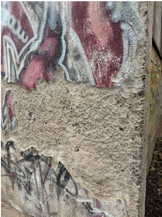
2025-01-14 Objekt- Schulstandort 49. GSSH, Bernhardstraße 80. 015Foto. Ansicht Nord-Ost: Bestandsputz mit Sokelbereich komplett entfernen (Minderfestigkeiten), Sokelbereich, Fremdbauteile entfernen und Ausgleichsputz als Klebefläche auftragen. WDVS auf tragfähigen Untergrund kleben