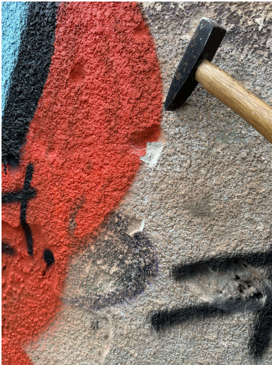
2025-01-14 Objekt- Schulstandort 49. GSSH, Bernhardstraße 80. 017Foto. Ansicht Nord-Ost: Bestandsputz mit Sokelbereich komplett entfernen (Minderfestigkeiten), Sokelbereich, Fremdbauteile entfernen und Ausgleichsputz als Klebefläche auftragen. WDVS auf tragfähigen Untergrund kleben