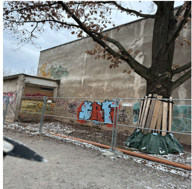
2025-01-14 Objekt- Schulstandort 49. GSSH, Bernhardstraße 80. 018Foto. Ansicht Nord-Ost: Bestandsputz mit Sokelbereich komplett entfernen (Minderfestigkeiten), Sokelbereich, Fremdbauteile entfernen und Ausgleichsputz als Klebefläche auftragen. WDVS auf tragfähigen Untergrund kleben