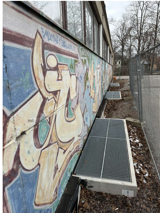
2025-01-14 Objekt- Schulstandort 49. GSSH, Bernhardstraße 80. 010Foto. Ansicht Süd-Ost: Bestandsputz mechanisch reinigen, Sokelbereich Anschluss an Perimeter herstellen, Fremdbauteile entfernen und ggf. grundieren. WDVS auf tragfähigen Untergrund kleben