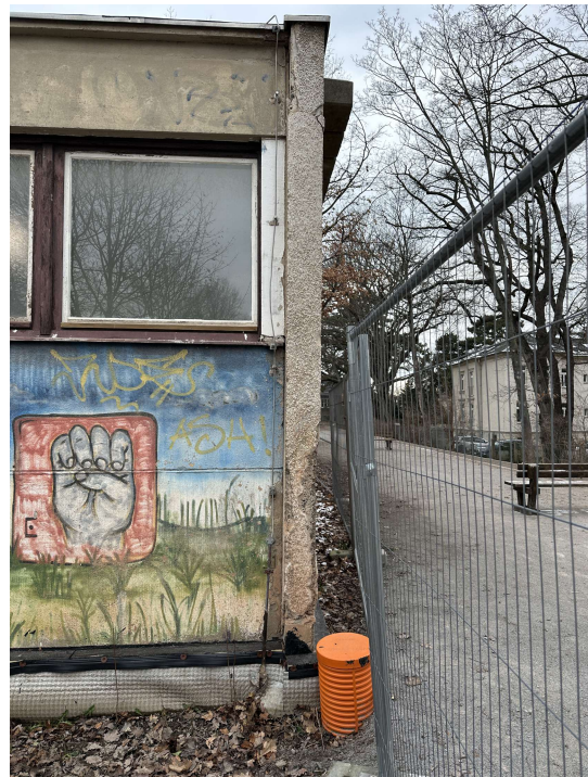
2025-01-14 Objekt- Schulstandort 49. GSSH, Bernhardstraße 80. 012Foto. Ansicht Süd-Ost: Bestandsputz mechanisch reinigen, Sokelbereich Anschluss an Perimeter herstellen, Fremdbauteile entfernen und ggf. grundieren. WDVS auf tragfähigen Untergrund kleben