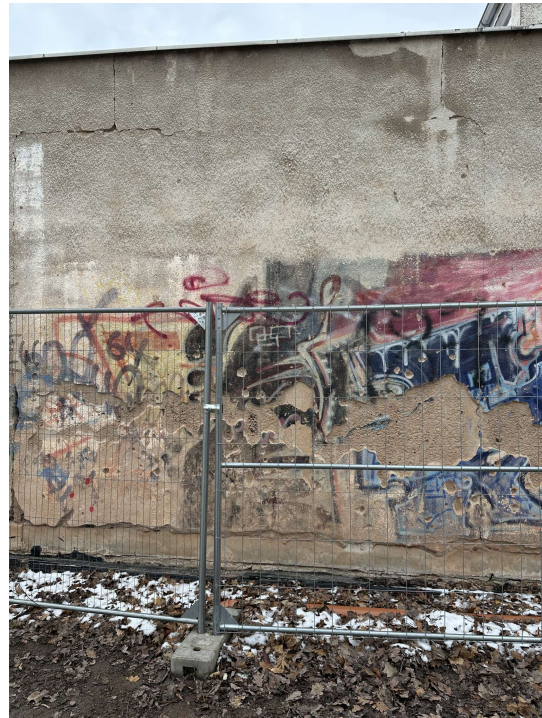
2025-01-14 Objekt- Schulstandort 49. GSSH, Bernhardstraße 80. 014Foto. Ansicht Nord-Ost: Bestandsputz mit Sokelbereich komplett entfernen (Minderfestigkeiten), Sokelbereich, Fremdbauteile entfernen und Ausgleichsputz als Klebefläche auftragen. WDVS auf tragfähigen Untergrund kleben