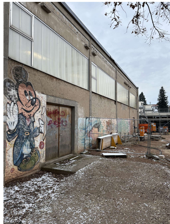
2025-01-14 Objekt- Schulstandort 49. GSSH, Bernhardstraße 80. 020Foto. Nord-Westseite ohne Relevanz für WDVS