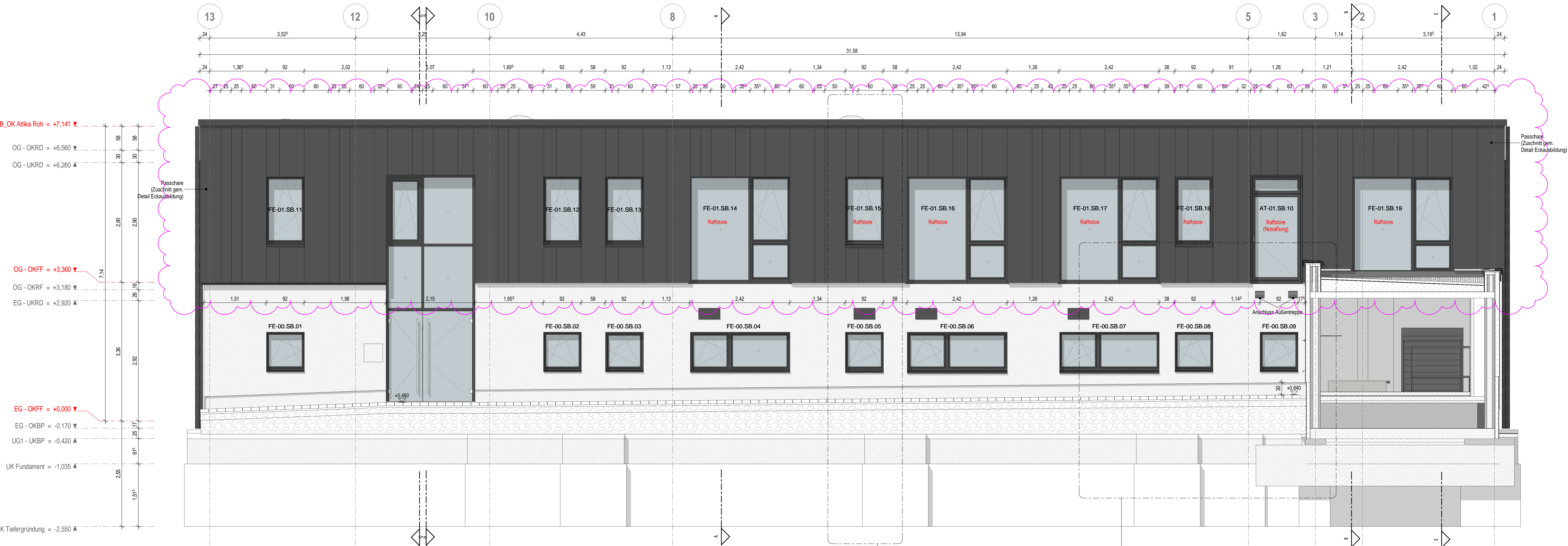
Ansicht Ost M 1:50