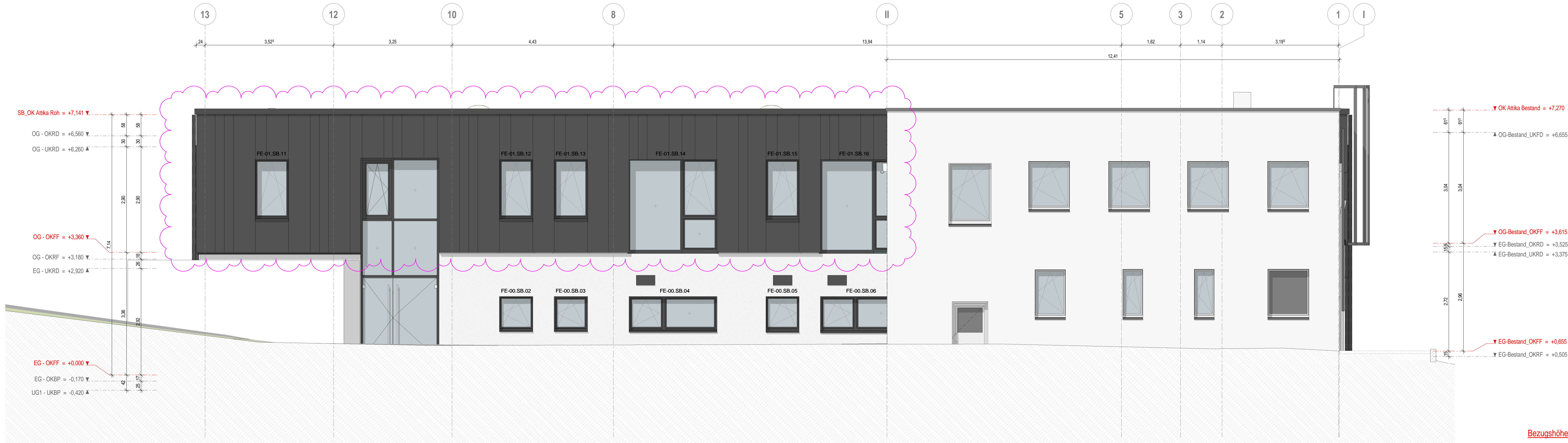
Ansicht Ost mit Bestandsgebäude M 1:50

Alle Angaben sind ohne Gewähr. Die Zeichnungen sind als Entwurf zu verstehen. Der Auftraggeber ist für die Richtigkeit der Angaben verantwortlich. Die Ausführung ist nach den Angaben in den Zeichnungen zu erfolgen. Die Ausführung ist nach den Angaben in den Zeichnungen zu erfolgen. Die Ausführung ist nach den Angaben in den Zeichnungen zu erfolgen.